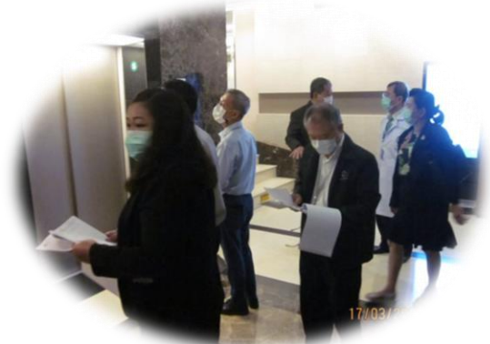
ออกตรวจสถานพยาบาล