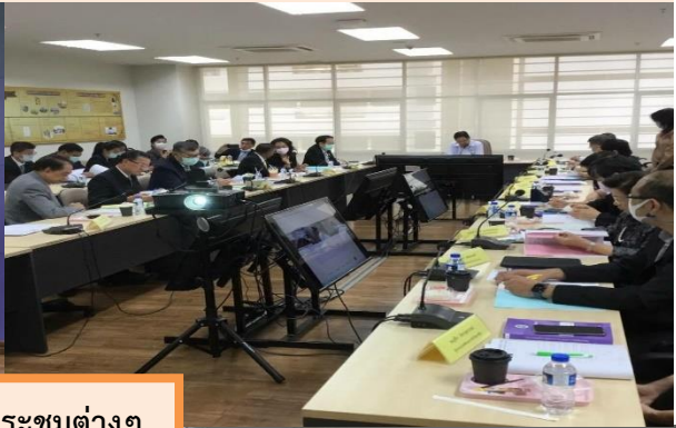
ภาพการประชุมต่างๆ