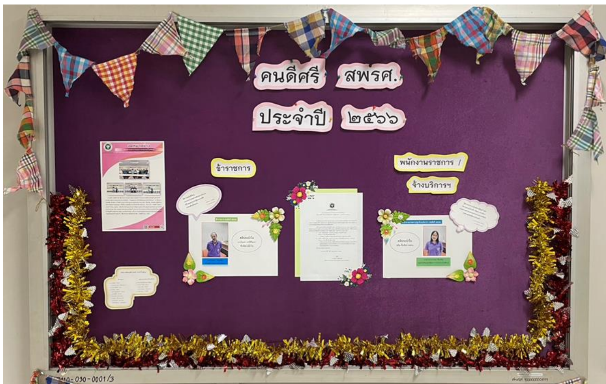
ขั้นตอนการจัดแสดงนิทรรศการเผยแพร่เกียรติคุณผู้ได้รับรางวัล “คนดีศรี สพรศ.” ประจำปี พ.ศ. ๒๕๖๖ ณ ชั้น ๕ กองสถานพยาบาลและการประกอบโรคศิลป์ กรมสนับสนุนบริการสุขภาพ