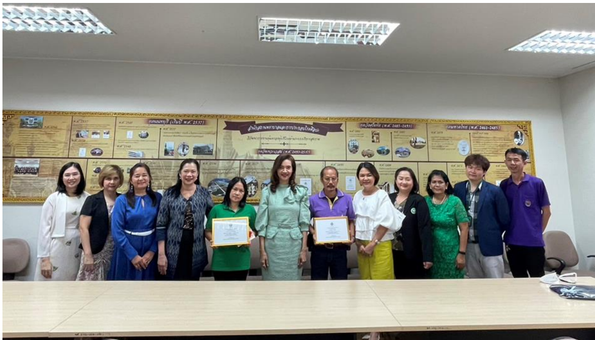
ขั้นตอนพิธีการมอบรางวัลและเสื่อสามารถผู้ได้รับรางวัล “คนดีศรี สพรศ.” ประจำปี พ.ศ. ๒๕๖๖ วันที่ ๗ มิถุนายน ๒๕๖๖ เวลา ๑๐.๐๐ น. ณ ชั้น ๕ กองสถานพยาบาลและการประกอบโรคศิลป์ กรมสนับสนุนบริการสุขภาพ