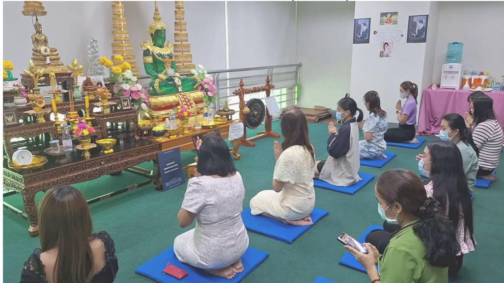
ผู้อำนวยการ และบุคลากรกองสถานพยาบาลและการประกอบโรคศิลปะ ร่วมสวดมนต์

โครงการที่ ๗ งานราชพิธี รัฐพิธี และงานพิธีการต่าง ๆ ของรัฐบาล กิจกรรมเฝ้ารับเสด็จพระบาทสมเด็จพระเจ้าอยู่หัว และสมเด็จพระนางเจ้าฯ พระบรมราชินี เสด็จพระราชดำเนินไปทรงเปิดอาคารมหิตลาธิเบศร วันที่ ๒๐ พฤศจิกายน ๒๕๖๕ เวลา ๑๗.๐๐ น. ณ กระทรวงสาธารณสุข จ.นนทบุรี