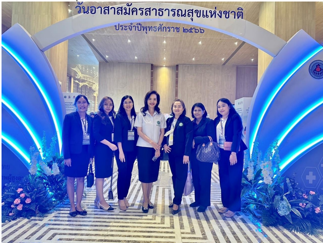
ผู้แทนกองสถานพยาบาลและการประกอบโรคศิลปะ ร่วมดำเนินงานวันอาสาสมัครสาธารณสุขแห่งชาติ

โครงการที่ ๕ การเสริมสร้างความสามัคคี และจิตสำนึก การเสียสละ เพื่อประโยชน์สาธารณะ ๕.๑ ส่งเสริมและบูรณาการงานของกรมสนับสนุนบริการสุขภาพ ในการร่วมดำเนินงาน วันอาสาสมัครสาธารณสุขแห่งชาติ วันที่ ๒๐ มีนาคม ๒๕๖๖ ณ โรงแรมแกรนด์ ริชมอนด์ จ.นนทบุรี