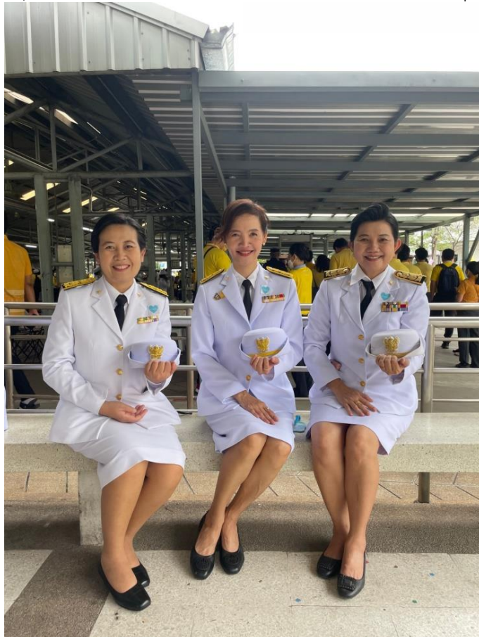
ผู้แทนกองสถานพยาบาลและการประกอบโรคศิลปะ ร่วมเฝ้ารับเสด็จฯ

โครงการที่ ๗ งานราชพิธี รัฐพิธี และงานพิธีการต่าง ๆ ของรัฐบาล กิจกรรมเฝ้ารับเสด็จพระบาทสมเด็จพระเจ้าอยู่หัว และสมเด็จพระนางเจ้าฯ พระบรมราชินี เสด็จพระราชดำเนินไปทรงเปิดอาคารมหิตลาธิเบศร วันที่ ๒๐ พฤศจิกายน ๒๕๖๕ เวลา ๑๗.๐๐ น. ณ กระทรวงสาธารณสุข จ.นนทบุรี