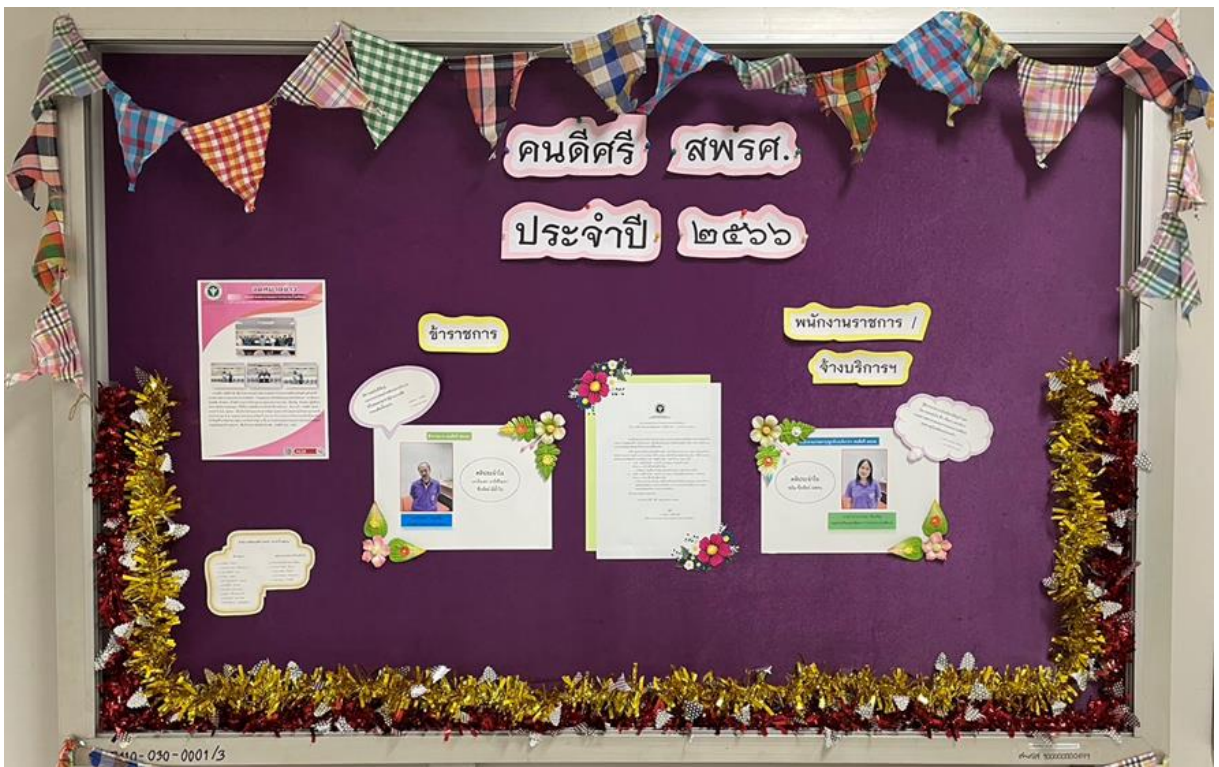
ขั้นตอนการจัดแสดงนิทรรศการเผยแพร่เกียรติคุณผู้ได้รับรางวัล “คนดีศรี สพรศ.” ประจำปี พ.ศ. ๒๕๖๖ ณ ชั้น ๕ กองสถานพยาบาลและการประกอบโรคศิลป์ กรมสนับสนุนบริการสุขภาพ