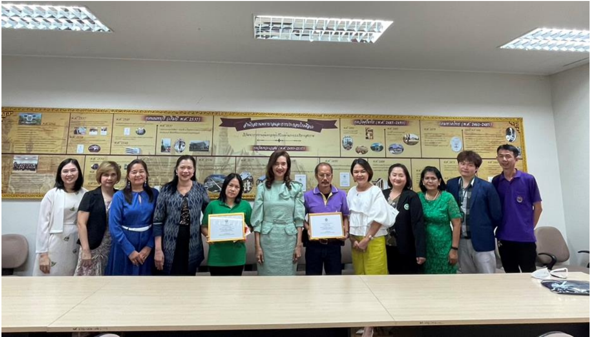
ขั้นตอนพิธีการมอบรางวัลและเสื่อสามารถผู้ได้รับรางวัล “คนดีศรี สพรศ.” ประจำปี พ.ศ. ๒๕๖๖ วันที่ ๗ มิถุนายน ๒๕๖๖ เวลา ๑๐.๐๐ น. ณ ชั้น ๕ กองสถานพยาบาลและการประกอบโรคศิลป์ กรมสนับสนุนบริการสุขภาพ