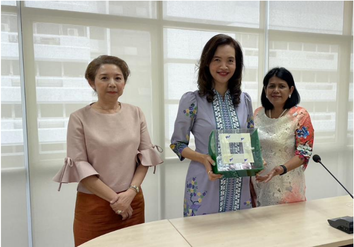
ขั้นตอนการนับคะแนนผู้ได้รับการเสนอชื่อ วันที่ ๒๕ พฤษภาคม ๒๕๖๖ เวลา ๐๙.๐๐ น. ณ ชั้น ๕ กองสถานพยาบาลและการประกอบโรคศิลปะ กรมสนับสนุนบริการสุขภาพ