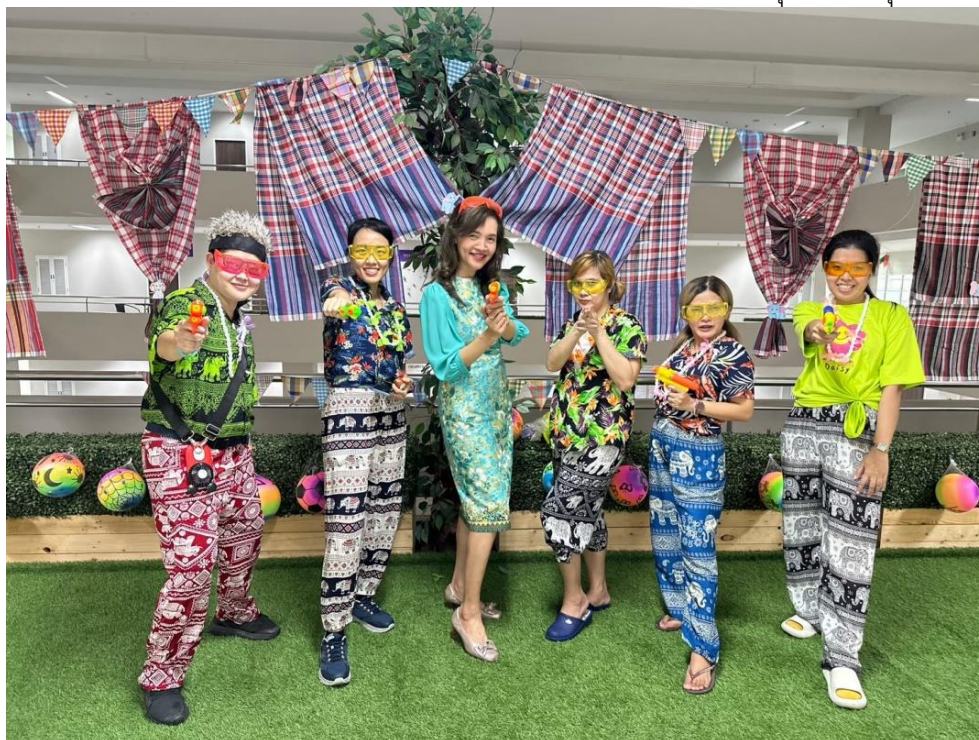
บุคลากรกองสถานพยาบาลและการประกอบโรคศิลปะ ร่วมเล่นน้ำ

ณ ชั้น ๕ กองสถานพยาบาลและการประกอบโรคศิลปะ กรมสนับสนุนบริการสุขภาพ