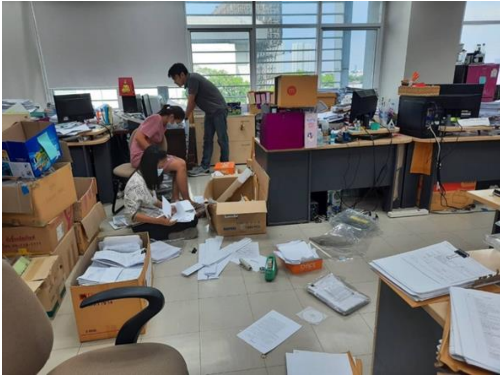
กองสถานพยาบาลและการประกอบโรคศิลปะ ก่อน ๕ส วันที่ ๗ เมษายน ๒๕๖๖