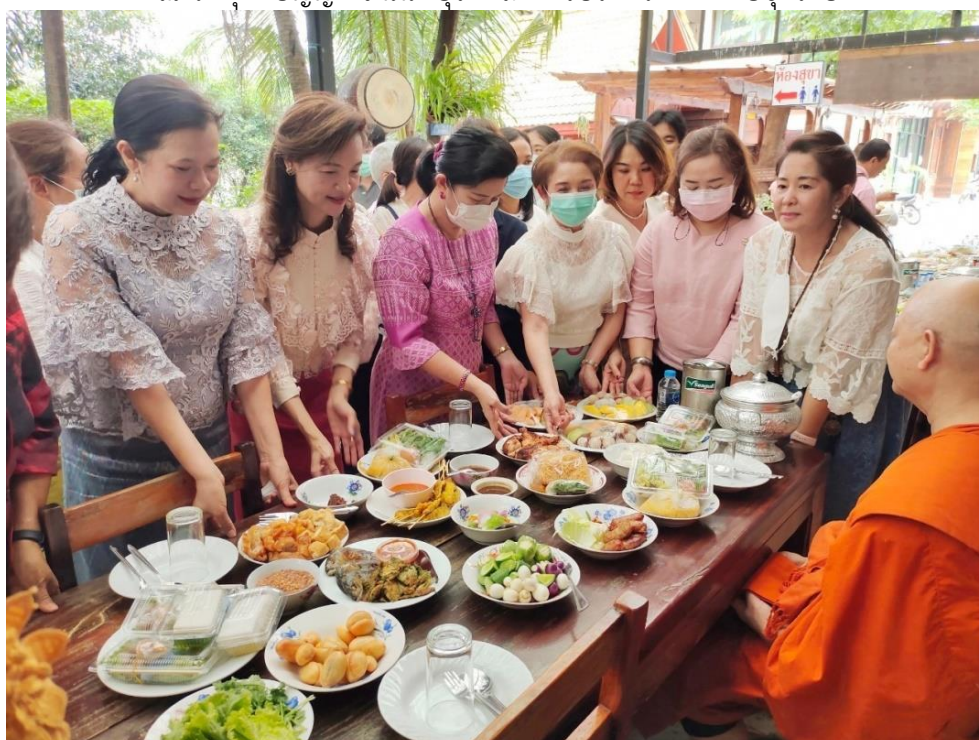
ผู้บริหารกองสถานพยาบาลและการประกอบโรคศิลปะ ร่วมถวายภัตตาหารเพล

ณ วัดพุทธปัญญา จ.นนทบุรี และการประกวดแต่งกายชุดไทย