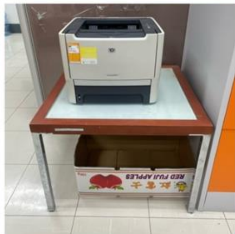
กองสถานพยาบาลและการประกอบโรคศิลปะ หลัง ๕ส เมื่อวันที่ ๗ เมษายน ๒๕๖๖