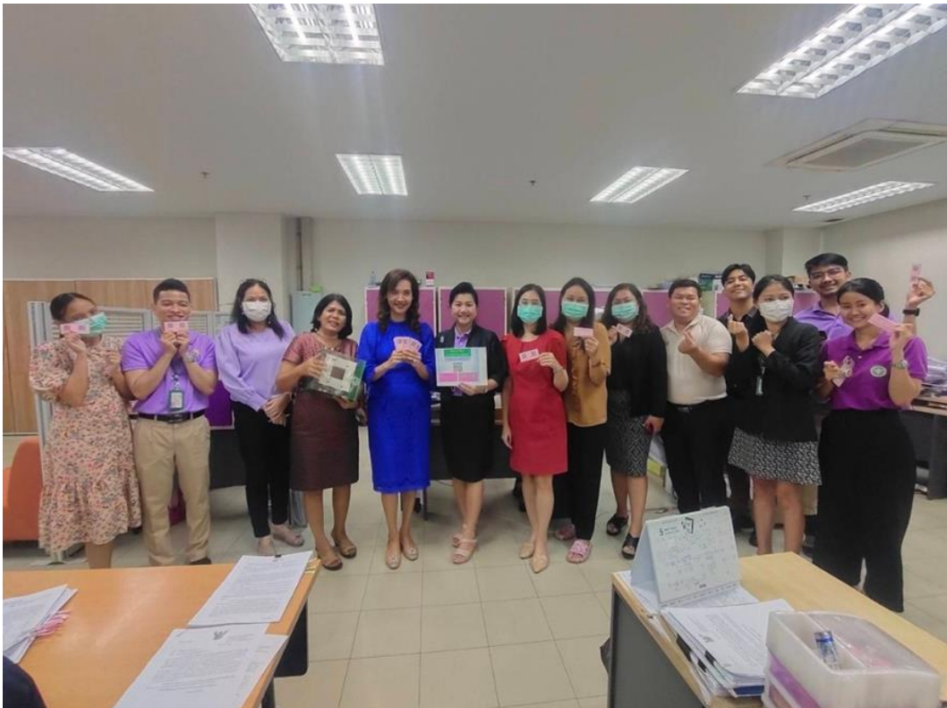
ขั้นตอนการรับบัตรและใช้สิทธิ วันที่ ๑๘-๒๔ พฤษภาคม ๒๕๖๖

ขั้นตอนการประชาสัมพันธ์รางวัล “คนดีศรี สพรศ.” ประจำปี พ.ศ. ๒๕๖๖ วันที่ ๑๒ พฤษภาคม ๒๕๖๖