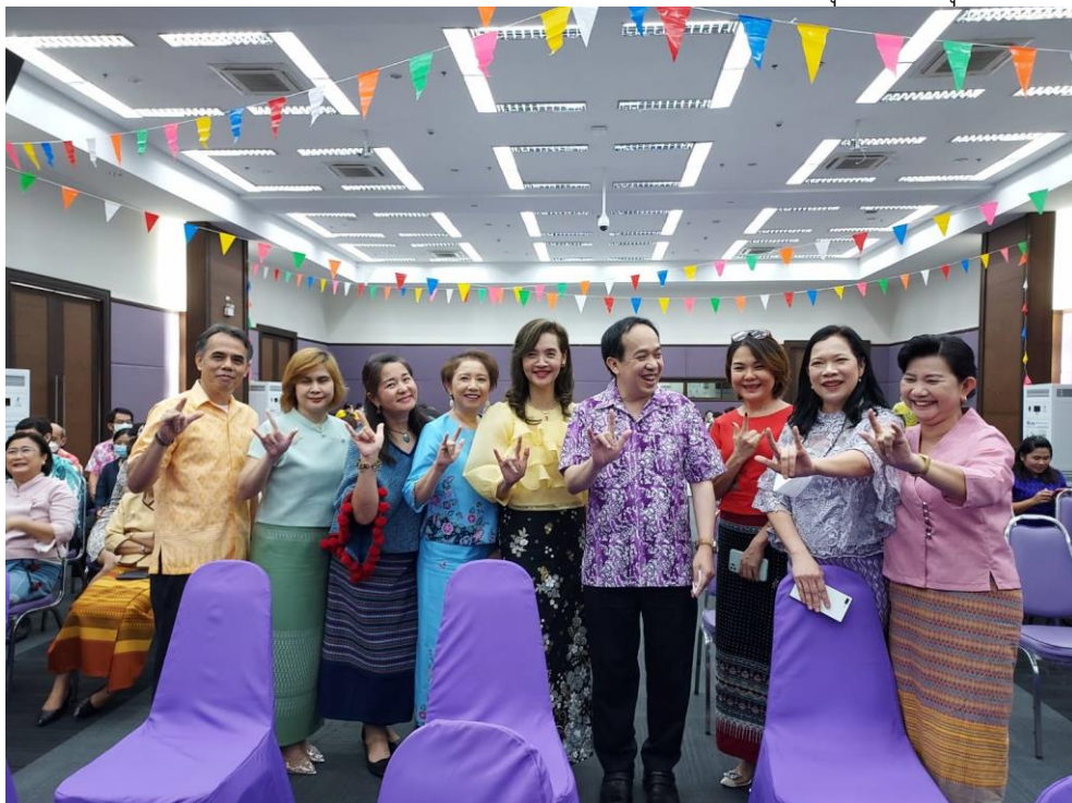
ผู้แทนกองสถานพยาบาลและการประกอบโรคศิลป์ ร่วมสรงน้ำพระ

๖.๒ สืบสานวัฒนธรรมวัฒนธรรมไทย สรงน้ำพระเนื่องในวันสงกรานต์ ประจำปี ๒๕๖๖ วันที่ ๑๐ เมษายน ๒๕๖๖ เวลา ๑๐.๓๐ น. ณ ชั้น ๙ กรมสนับสนุนบริการสุขภาพ