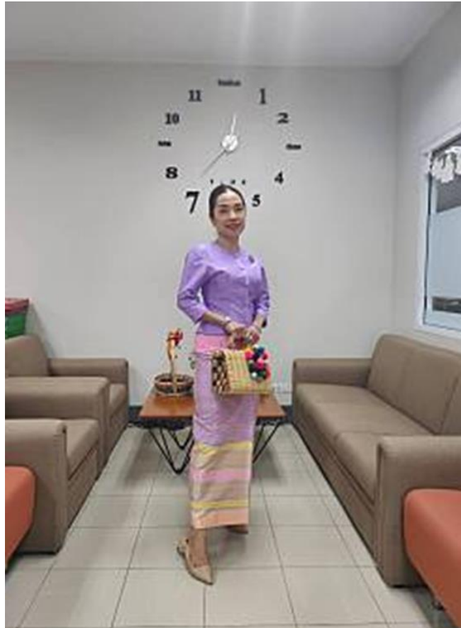
ผู้ชนะการประกวดแต่งกายชุดไทย อันดับที่ ๑