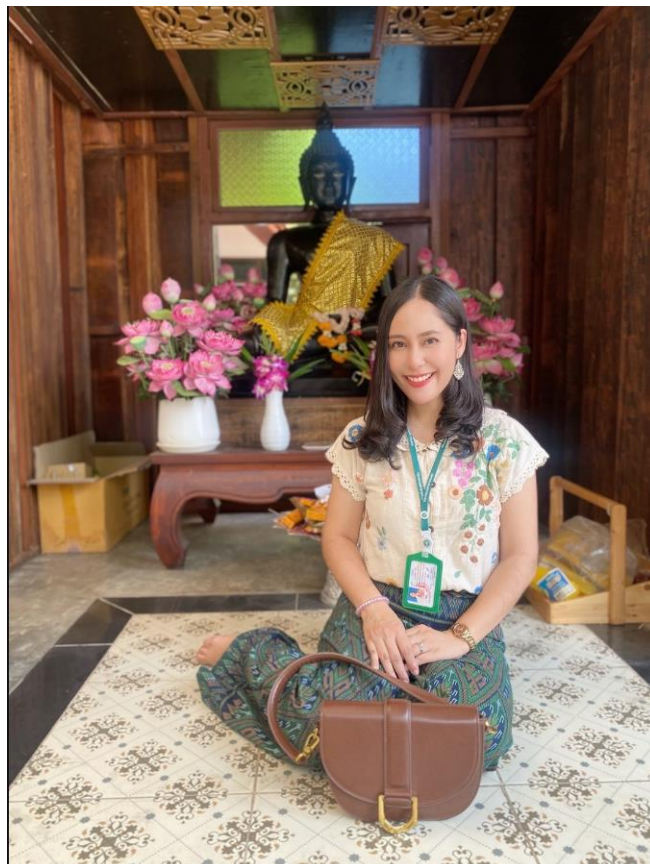
ผู้ชนะการประกวดแต่งกายชุดไทย อันดับที่ ๒