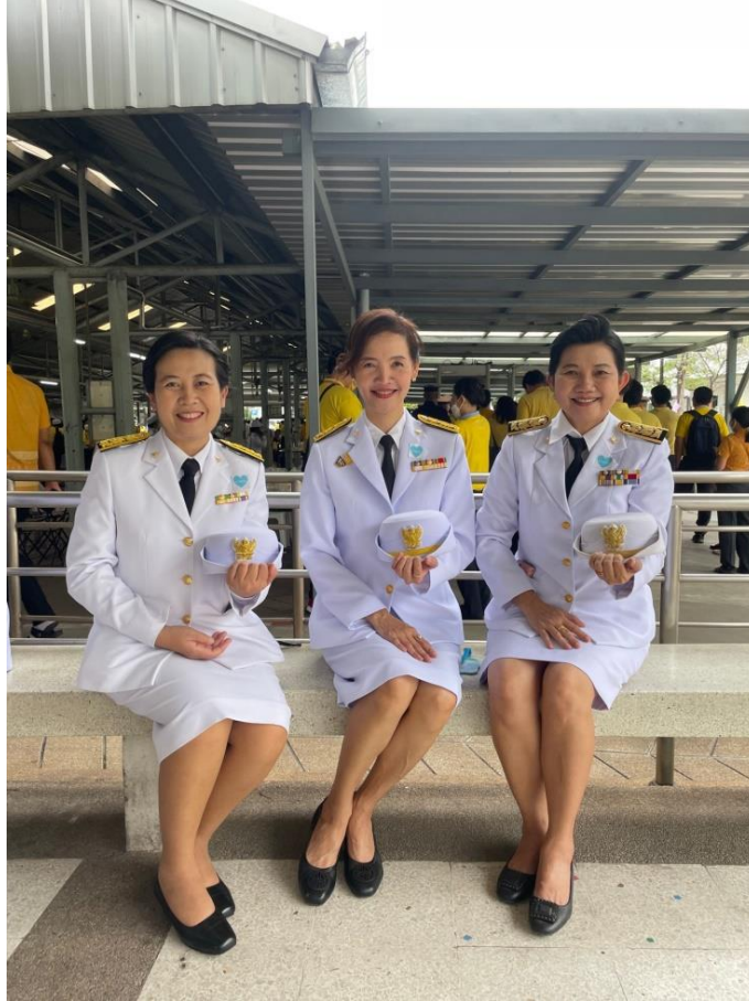
ผู้แทนกองสถานพยาบาลและการประกอบโรคศิลปะ ร่วมเฝ้ารับเสด็จฯ

โครงการที่ ๗ งานราชพิธี รัฐพิธี และงานพิธีการต่าง ๆ ของรัฐบาล กิจกรรมเฝ้ารับเสด็จพระบาทสมเด็จพระเจ้าอยู่หัว และสมเด็จพระนางเจ้าฯ พระบรมราชินี เสด็จพระราชดำเนินไปทรงเปิดอาคารมหิตลาธิเบศร วันที่ ๒๐ พฤศจิกายน ๒๕๖๕ เวลา ๑๗.๐๐ น. ณ กระทรวงสาธารณสุข จ.นนทบุรี